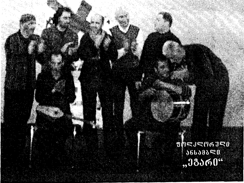
ფოლკლორული ანსამბლი „ეგარი“

გამოფენა-ბაზრობაზე წარმოდგენილი იყო ქართული სუვენირები და გამოფენებითი ხელოვნება.